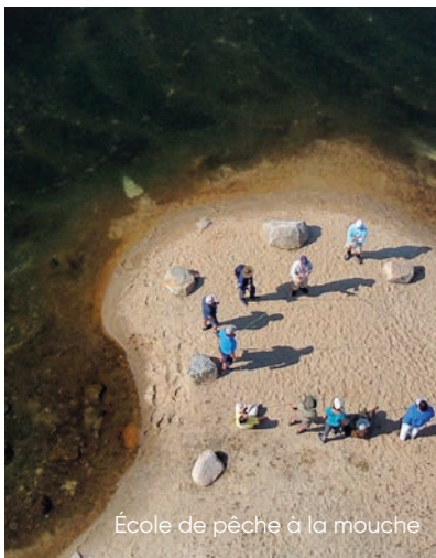
École de pêche à la mouche