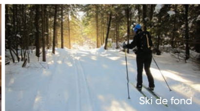
Ski de fond