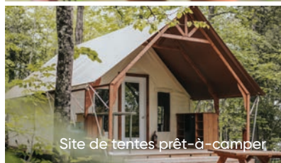
Site de tentes prêt-à-camper