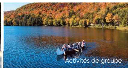
Activités de groupe