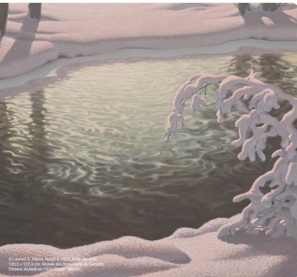
© Lawren S. Harris, Neigé II, 1915, huile sur toile, 120,3 x 127,3 cm. Musée des beaux-arts du Canada, Ottawa. Acheté en 1916